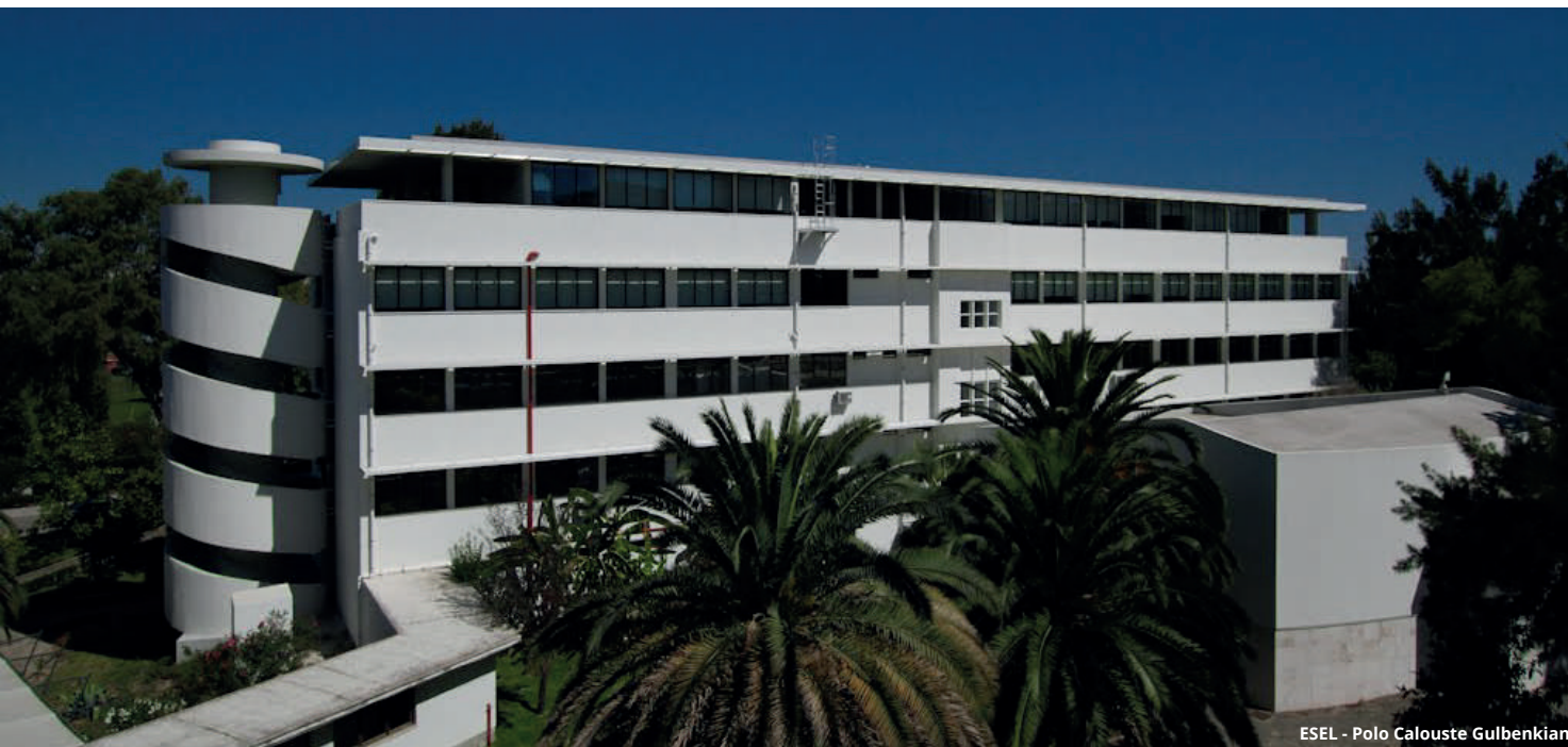
ESEL - Polo Calouste Gulbenkian