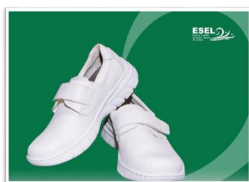
Figura 5 – Sapatos (modelo Florência – à esquerda - e Milán – à direita)

Sapatos – cor branca, fechados com velcro, sola antiderrapante e resistente, raso ou com cunha de 3 a 3,5cm. Estão disponíveis dois modelos para escolha pelos estudantes (cf. figura 5).