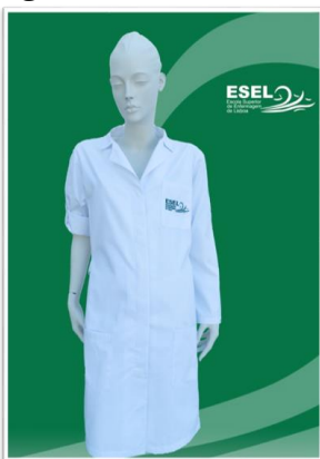
Figura 4 – Bata

Sapatos – cor branca, fechados com velcro, sola antiderrapante e resistente, raso ou com cunha de 3 a 3,5cm. Estão disponíveis dois modelos para escolha pelos estudantes (cf. figura 5).