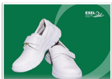
Figura 5 – Sapatos (modelo Florência Plus – à esquerda - e Milán – à direita)

Sapatos – cor branca, fechados com velcro, sola antiderrapante e resistente, raso ou com cunha de 3 a 3,5cm. Estão disponíveis dois modelos para escolha pelos estudantes (cf. figura 5).