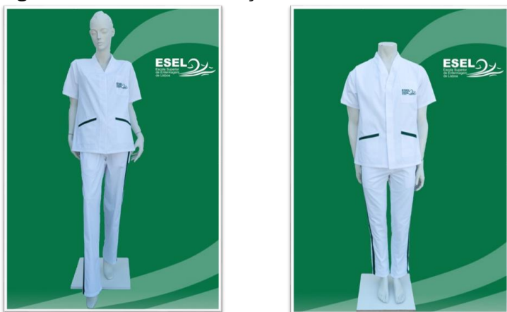
Figura 1 e 2 – Túnica e calça (modelo feminino e modelo masculino)

Calça – cor branca, com barra de cor verde (pantone 7733 C) na face lateral externa da calça, obedecendo a modelos ESEL distintos na versão masculino e feminino. É recomendada a aquisição de, pelo menos, 2 unidades (cf. figura 1 e 2).