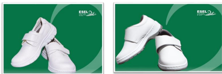
Figura 5 – Sapatos (modelo Florência – à esquerda - e Milán – à direita)

Devem utilizar-se exclusivamente meias ou collants de cor branca ou transparentes.