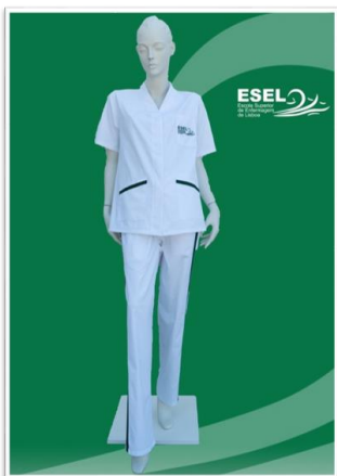
Figura 1 e 2 – Túnica e calça (modelo feminino e modelo masculino)

Calça – cor branca, com barra de cor verde (pantone 7733 C) na face lateral externa da calça, obedecendo a modelos ESEL distintos na versão masculino e feminino. É recomendada a aquisição de, pelo menos, 2 unidades (cf. figura 1 e 2).