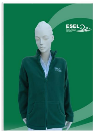
Figura 3 – Casaco tipo polar

Bata – cor branca, em sarja, obedecendo a modelo ESEL (tipo “guarda pó”). É recomendada a aquisição de 1 unidade (cf. figura 4).