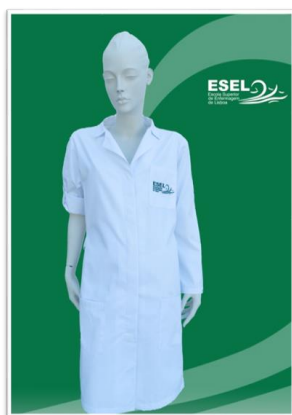
Figura 4 – Bata

Sapatos – cor branca, fechados com velcro, sola antiderrapante e resistente, raso ou com cunha de 3 a 3,5cm. Estão disponíveis dois modelos para escolha pelos estudantes (cf. figura 5).