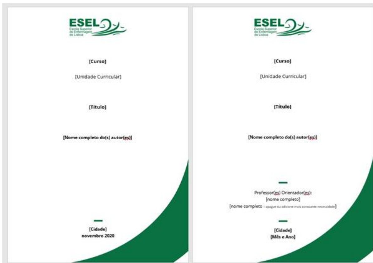
Figura 1: Modelo da Capa (esquerda) e folha de rosto (direita)

O título de cada publicação deve ser curto, claro e sintetizar o conteúdo do trabalho. Poderá ser completado com um subtítulo. Este deve ficar com o mesmo tamanho de letra, mas deve retirar o bold.