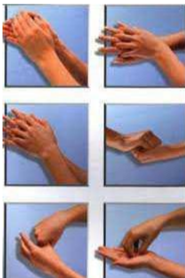
Figura 1. Técnica de lavagem de mãos