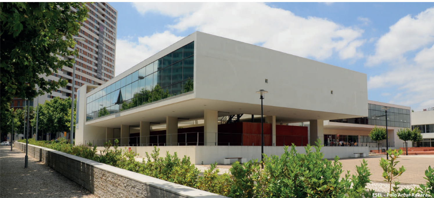
ESEL - Polo Artur Ravara

Todos os cursos de Mestrado da Escola Superior de Enfermagem de Lisboa, estão acreditados pela A3ES.